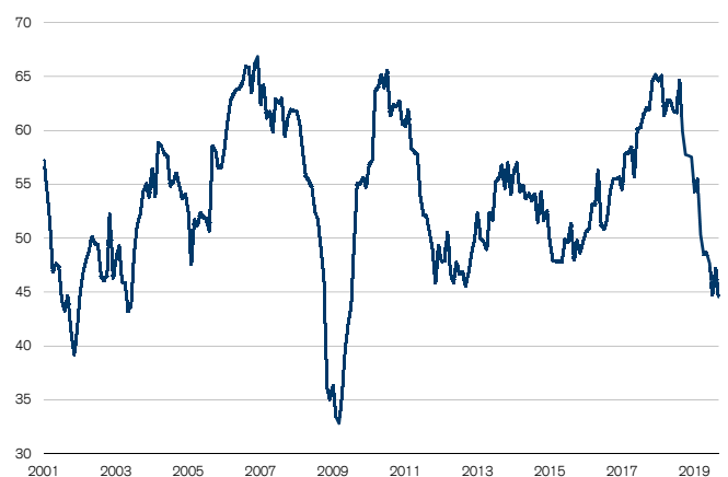
Fig. 1: Recul du PMI industrie à un plancher depuis 2009 Seuil de croissance = 50

«carnets de commandes» s'est effondré au cours du mois sous revue (-6,2 points) pour clôturer largement sous le seuil de croissance à 41,2 points.