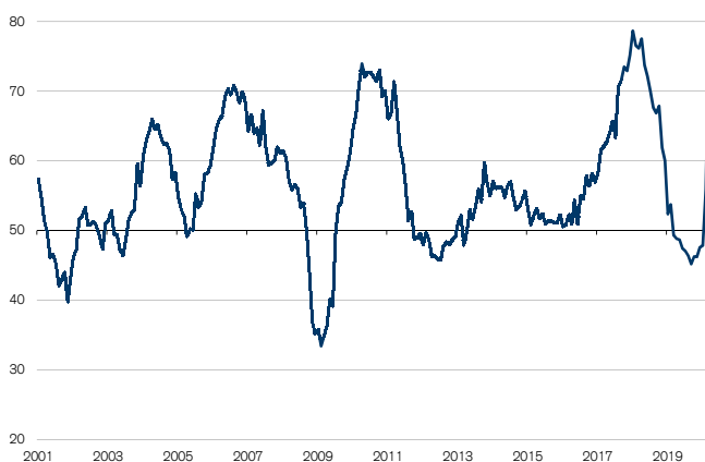
Fig. 2: Délais de livraison plus longs en raison des ruptures Seuil de croissance = 50

L'allongement des délais de livraison – le sous-indice correspondant a bondi de 20,1 points à 76,1 points en mars – n'est pas un signe positif dans le contexte actuel (cf. fig. 2). En temps normal, des délais de livraison plus longs suggèrent un meilleur taux d'exploitation des capacités, raison pour laquelle toute hausse de ce sous-indice est considérée comme positive pour le PMI dans son ensemble (pondération de 20%). Or, les délais de livraison s'allongent actuellement non pas en raison d'une meilleure exploitation des capacités de production, mais du fait de ruptures d'approvisionnement liées aux mesures prises contre la propagation du coronavirus. Notre enquête comportait donc une question subsidiaire visant à identifier les pays dans lesquels la disponibilité des marchandises s'était dégradée. C'est l'Italie qui est citée le plus souvent, suivie de l'Allemagne et de la Chine, bien que 12% des sondés ont indiqué que la situation s'était améliorée dans cette dernière par rapport au mois précédent. S'agissant des attentes envers la politique, ce sont les aides aux importations et plus généralement le transport qui figurent en tête de liste des exigences les plus citées (11%). La situation en Suisse est également source d'inquiétude, puisque près de 17% des participants ont indiqué qu'il fallait, dans la mesure du possible, éviter les fermetures d'entreprises et de chantiers.