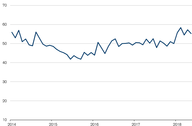
Fig. 4: Création d'emplois dans le secteur des services également

commerciale, équivalent de la production dans l'industrie. Le sous-indice correspondant s'est envolé de 10,6 points pour s'établir à 71,4 points. La situation est aussi réjouissante sur le front des carnets de commandes: le sous-indice n'a certes plus atteint le niveau élevé du mois précédent (ce qui n'est cependant guère surprenant au vu de l'activité commerciale dynamique), mais les entrées de commandes ont davantage progressé qu'en avril.