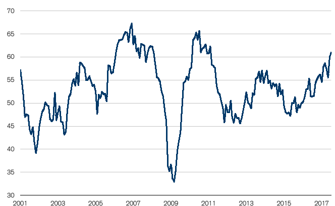
Fig. 1: PMI manufacturier à un sommet depuis 2011 Seuil de croissance = 50