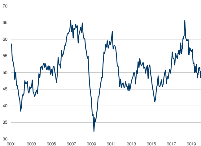
Fig. 2: Pas de suppressions de postes dans l'industrie Seuil de croissance = 50

Évolution plus réjouissante en ce début d'année: les entreprises n'avaient plus créé autant d'emplois depuis juillet 2019 (cf. fig. 2). Le niveau actuel de 52,1 points signale une croissance de l'emploi conforme à la moyenne à long terme. De toute évidence, la faible demande de produits industriels n'a jusqu'à présent pas affecté durablement le marché du travail dans l'industrie: à l'exception des mois de décembre, septembre, août et mai 2019, le sous-indice correspondant se maintient en zone de croissance depuis 2017. Et sa récente progression laisse supposer que le risque de contagion reste faible en 2020 également.