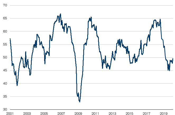
Fig. 1: PMI industrie très proche du seuil de croissance Seuil de croissance = 50

s'inscrire à 49,2 points). Le sous-indice «emploi» pointe même au-dessus du seuil de croissance, ce qui suggère que la situation sur le marché du travail ne se détériore pas. Le constat est plus mitigé sur le front des commandes: à 45,6 points, le sous-indice «carnets de commandes» reste nettement inférieur au seuil de croissance, ce qui ne laisse guère présager d'augmentation de la production dans un avenir proche.