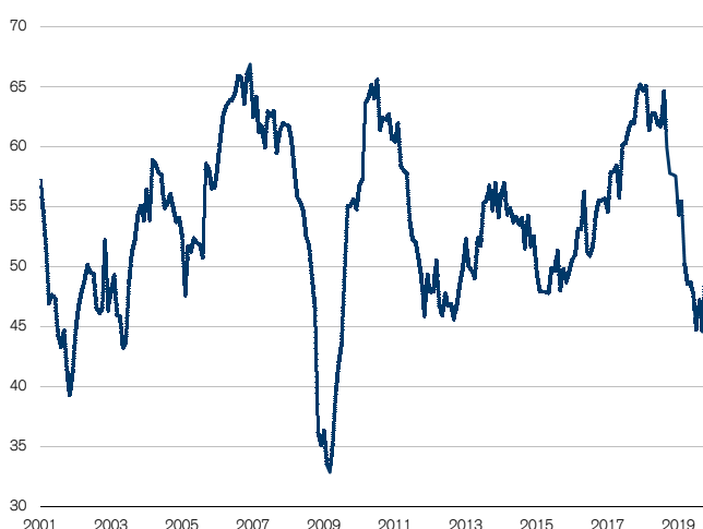
Fig. 1: PMI industrie presque sur le seuil de croissance Seuil de croissance = 50

L'indice des directeurs d'achats (PMI) procure.ch s'est établi à un niveau de 50,2 points en décembre. Il clôture ainsi son troisième mois consécutif proche du seuil de croissance de 50 points, mais le dépasse pour la première fois depuis mars 2019 (cf. fig. 1). Par rapport au mois précédent, il affiche une progression de 1,4 point.