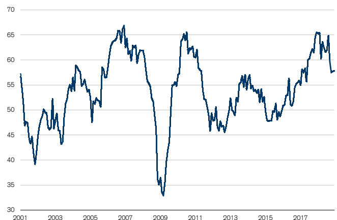
Fig. 1: Stabilisation du PMI après une phase de déclin Seuil de croissance = 50

En décembre, l'indice des directeurs d'achat (PMI) procure.ch a atteint 57,8 points, signant ainsi son deuxième mois consécutif de quasi-stabilité (+0,1 point, cf. fig. 1). En 2018, le PMI s'est inscrit en moyenne à 61,5 points. Seules les années 2010, 2007 et 2006 ainsi que 2000 – marquées par un boom économique – avaient affiché une moyenne plus élevée. Cela dit, le PMI n'a cessé de perdre du terrain au cours de l'année 2018, le recul observé au 3e trimestre ayant été particulièrement prononcé.