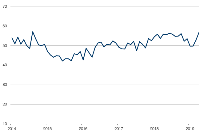
Fig. 4: L'emploi augmente de nouveau dans les services Seuil de croissance = 50

Un examen des sous-indices suggère que le résultat d'avril n'est pas partout simplement le produit d'une aberration à la hausse: la composante beaucoup moins volatile de l'emploi a notamment augmenté pour le deuxième mois consécutif et, à 56,8 points en avril, s'est de nouveau inscrite en zone de croissance, encore plus nettement qu'en mars (cf. fig. 4). Comme dans le secteur industriel, les entreprises de services semblent rester confiantes dans la situation conjoncturelle. Les valeurs d'indice les plus élevées se retrouvent à nouveau dans le carnet de commandes, l'activité commerciale et les entrées de commandes, qui finissent tous, parfois nettement, au-dessus du seuil des 60 points. Entre-temps, les prix ont peu fluctué, mais leur tendance est toujours à la hausse.