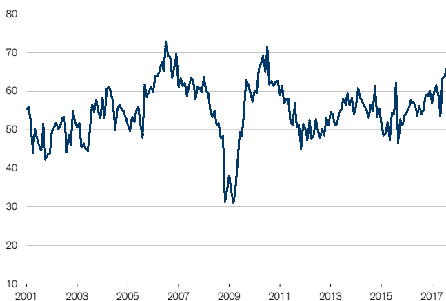
Abb. 2: Subkomponente "Produktion" schwankt stark Wachstumsschwelle = 50

Das geringere Steigerungstempo könnte zudem aufkommenden Kapazitätsengpässen zuzuschreiben sein. Auf solche deuten nämlich auch die stark zunehmenden Lieferfristen hin. Die entsprechende Subkomponente notierte im September nur noch wenig unter ihrem historischen Höchststand (vgl. Abb. 3). Ebenfalls auf gut ausgelastete Kapazitäten lässt der erneute Personalaufbau schliessen, auch wenn dieser wieder eher verhalten ausfiel. Auch die Einkaufspreise sind markant gestiegen, wobei dafür vor allem die Abwertung des CHF und die damit einhergehende Verteuerung von Importprodukten verantwortlich sein dürften.