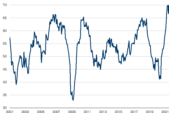
Abb. 1: Industrie-PMI gibt deutlich nach Wachstumsschwelle = 50